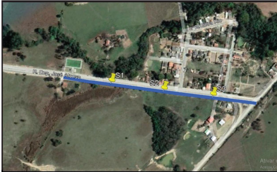
Localização dos pontos

execução da obra, fica estabelecido que: Caso encontre pontos no subleito com CBR igual ou superior 6% e expansão \geq 2\% , necessitará ser feito a substituição nestes locais.