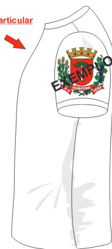
lado esquerdo (brasão do Município)

Quando for escola particular colocar a logo.