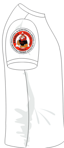
lado direito (logo PROERD)

Sede: Praça Otacílio Ferreira - Fone/Fax: (0xx43) 3561-1221 CNPJ 75.968.412/0001-19